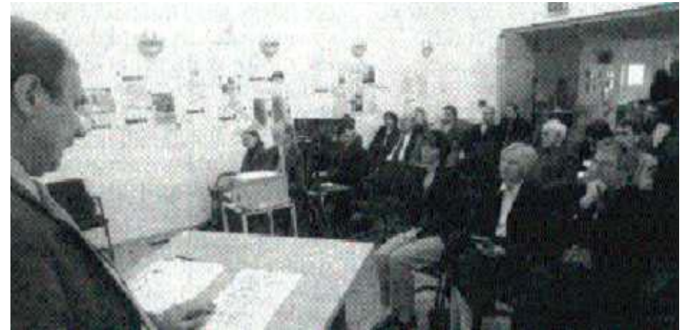
Hilfe zur Selbsthilfe: Experten referierten über Chancen . . .