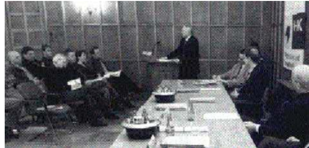
. . . und Gefahren einer Existenzgründung.